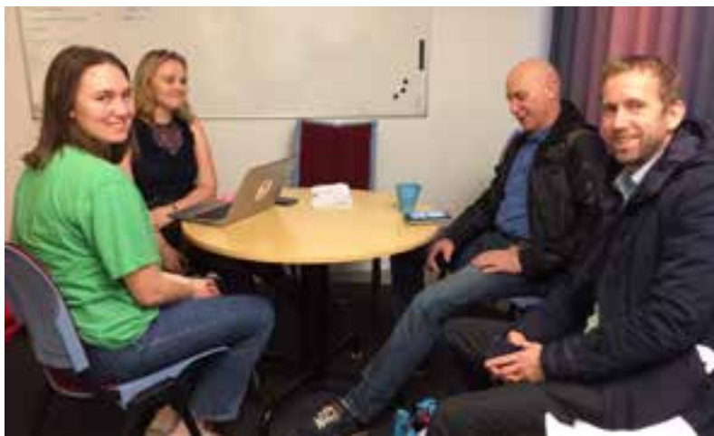
Ungdomsrådet har drop in och får besök av kommunpolitiker.

Projektledaren frågar berörda kontorschefer vilka tjänstepersoner som kan delta och som har den kompetens som fordras i ett partnerskap. Politikernas deltagande beslutas av respektive nämnd. Oftast är det kommunstyrelsen som ingår.