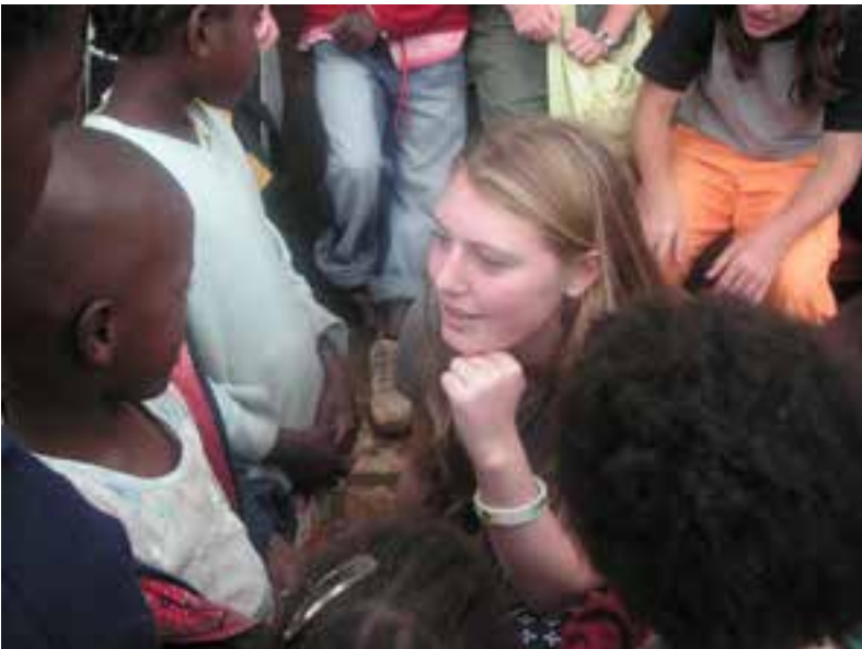
Möten mellan unga som skapar oförglömliga minnen.