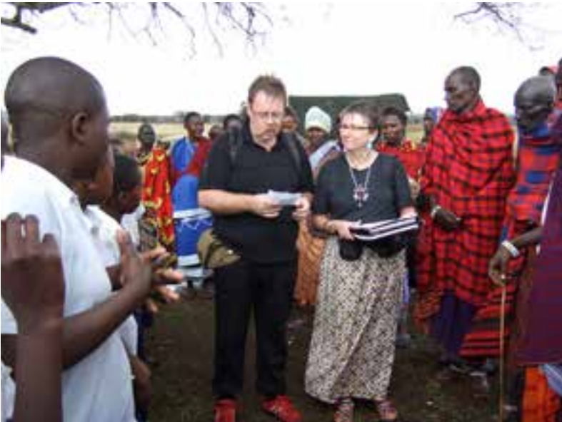
Svenska politiker från majoritet och opposition gör ett gemensamt uttalande om barns rättigheter.