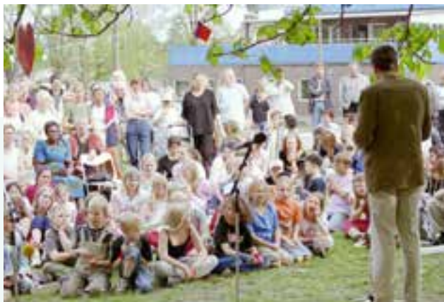
Ordförande i kommunfullmäktige inviger Barnens Mötesplats i Strängnäs.