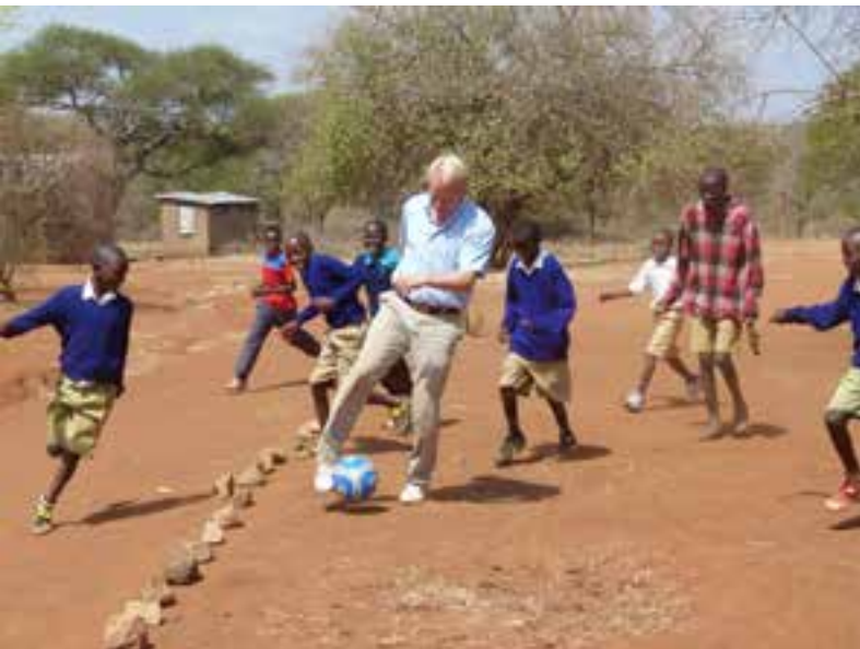
Kommunstyrelsens ordförande är med på rasten.