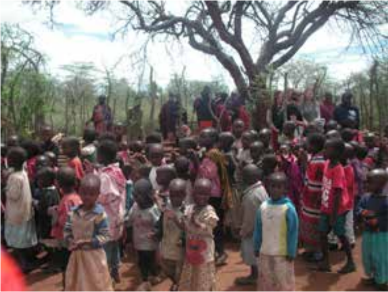
Samling vid Children's Meeting Place i en by i Simanjiro.