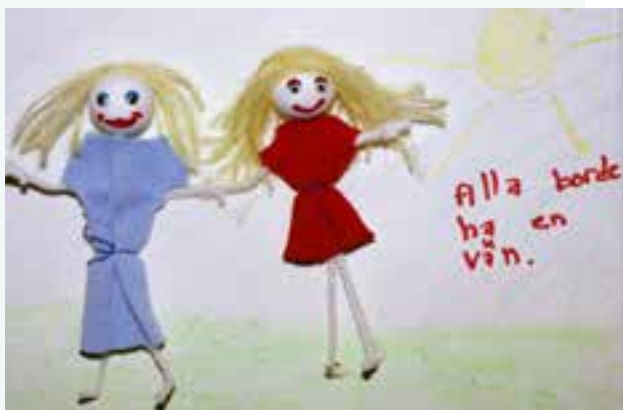
Ett av bidragen till invigningen.