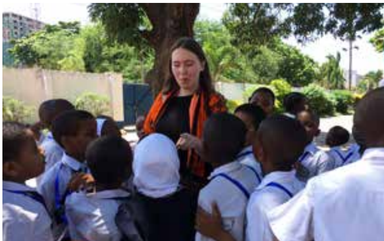
Gemensam lek på skolgården i Ilala.