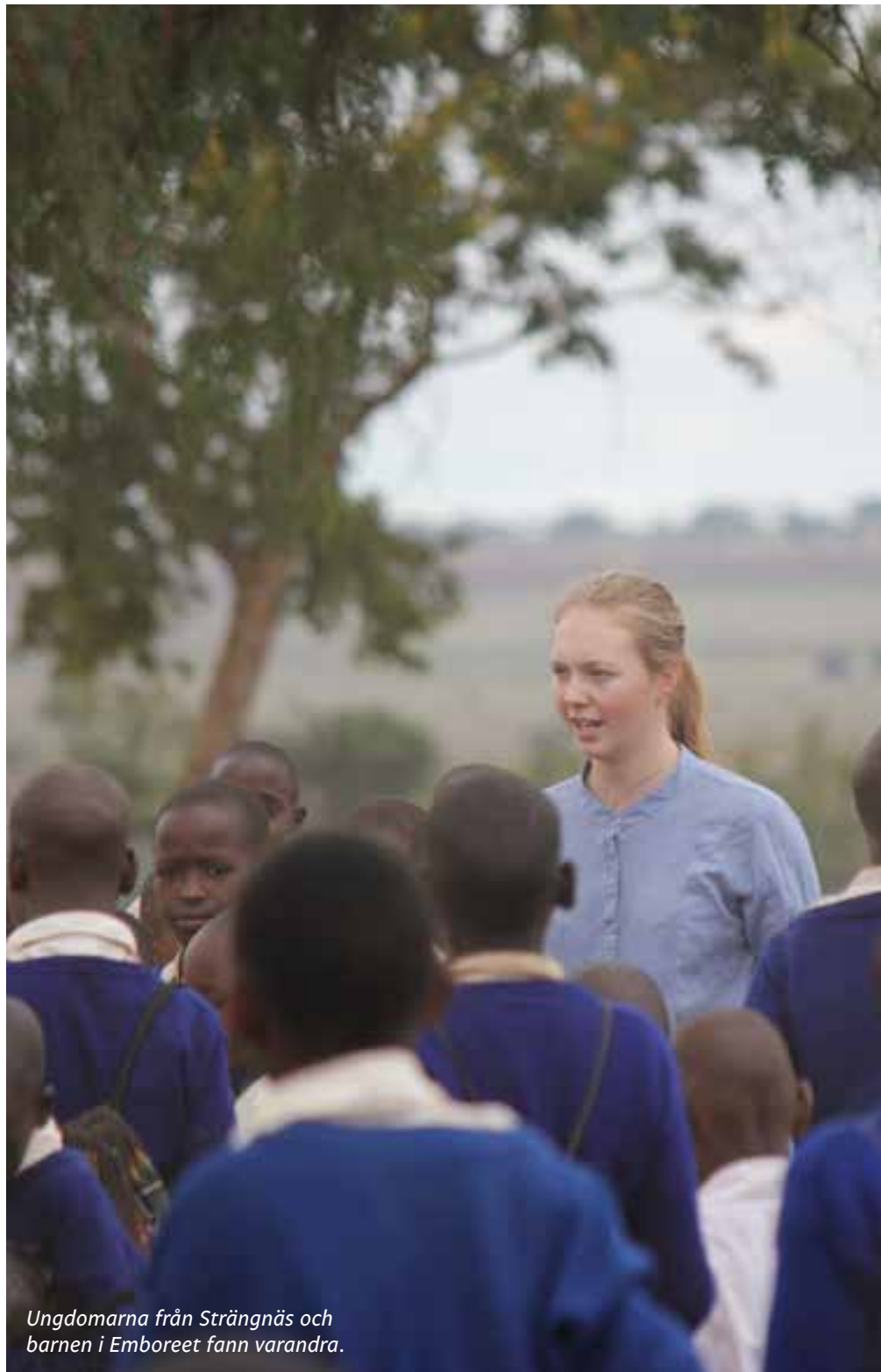
Ungdomarna från Strängnäs och barnen i Emboreet fann varandra.