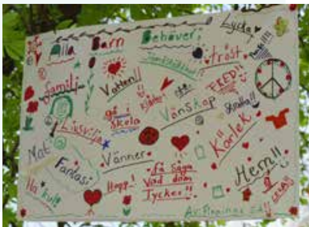
En skola gjorde en gemensam bild av vad alla barn behöver