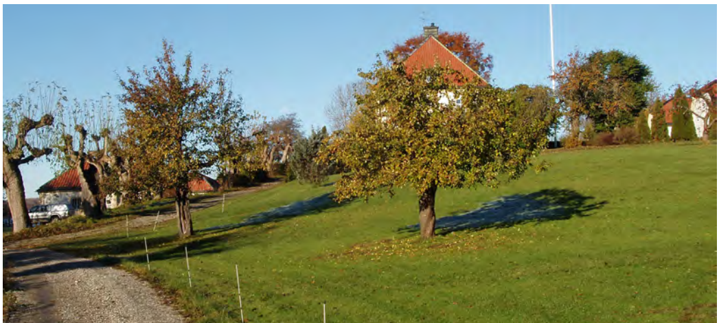
Trädgård, Herresta säteri, Toresunds sn