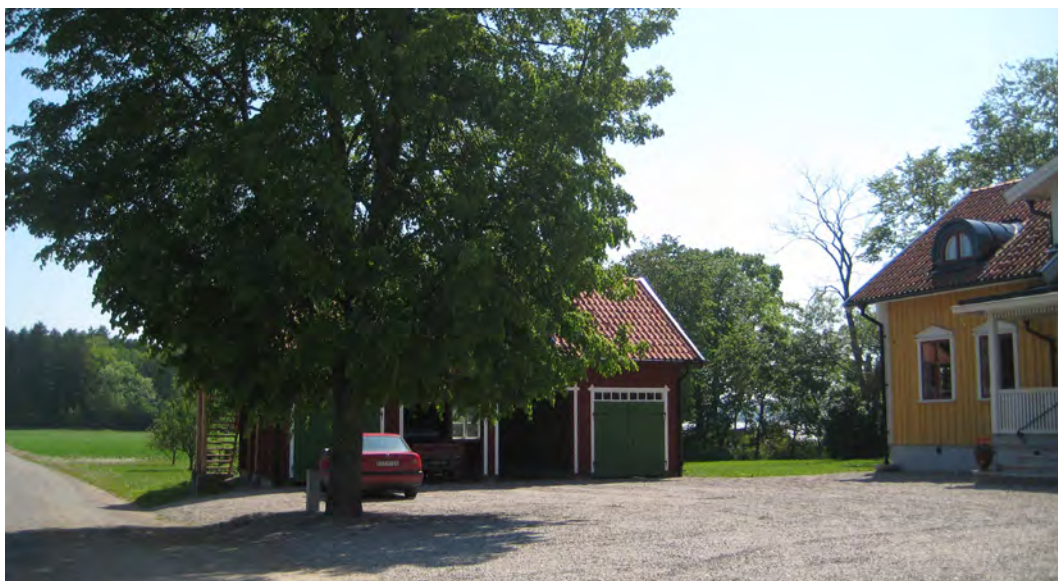
Ny komplementbyggnad som anpassats till den lokala byggnadstraditionen i Stenby på Tosterö, Strängnäs kommun