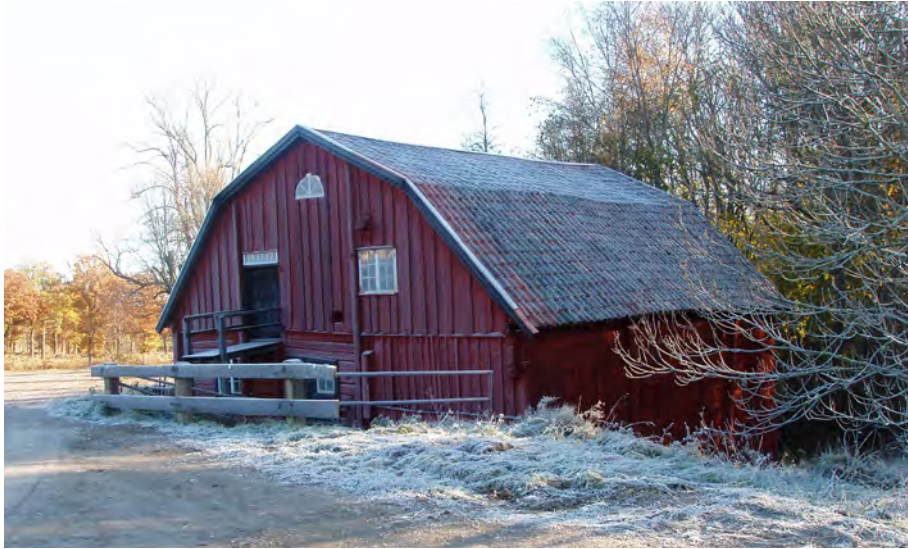
Vattenkvarn, Rävsnäs säteri, Toresunds sn