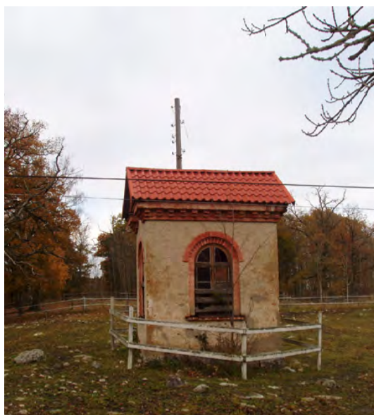
Transformatorstation, Mälsåker slott, Ytterselö sn