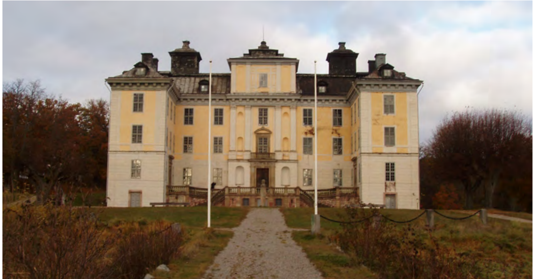
Manifesterande huvudbyggnad, Mälsåkers slott, Ytterselö sn