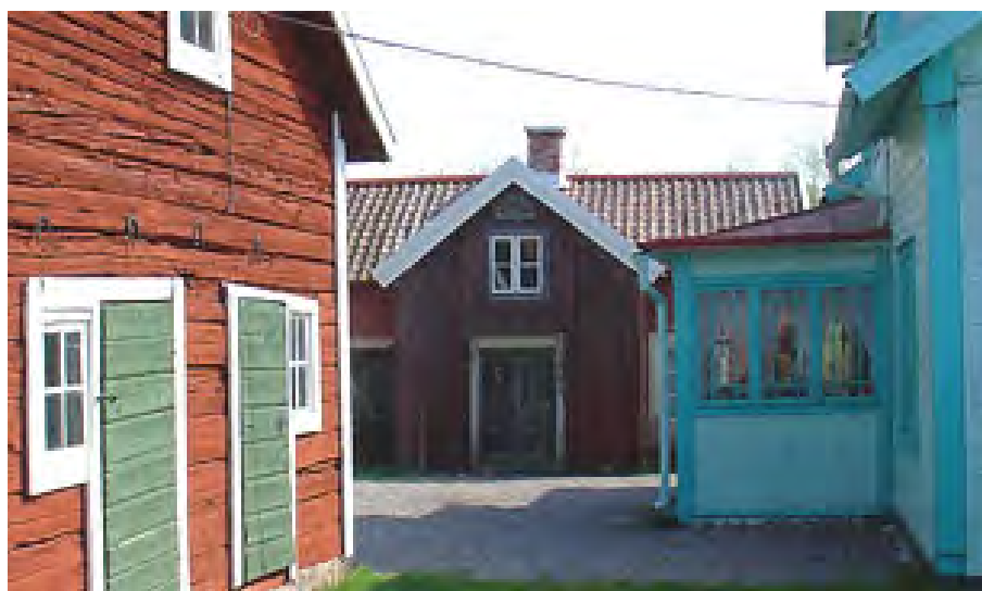
Samlad by, Hannemyra by, Fogdö sn