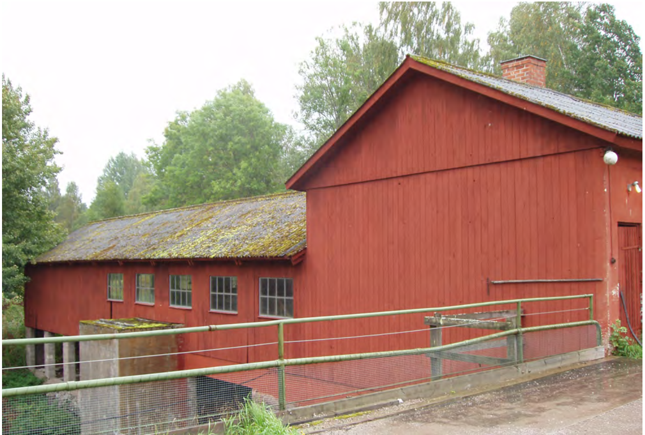
Kvarn Länna bruk, Länna sn