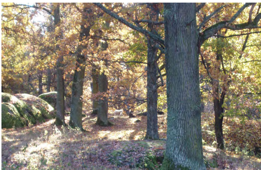
Ekdunge, Herresta säteri, Toresunds sn