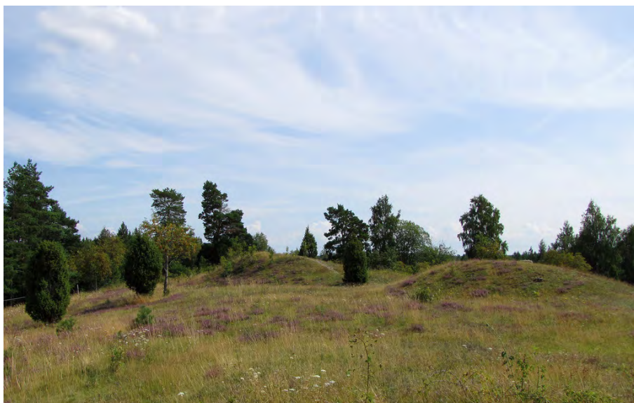
Bygravfält, Husby, Fogdö sn