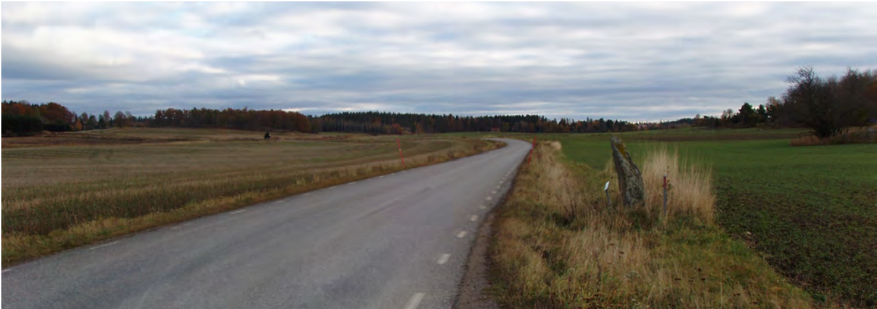
Runsten vid allfarväg, Selaön