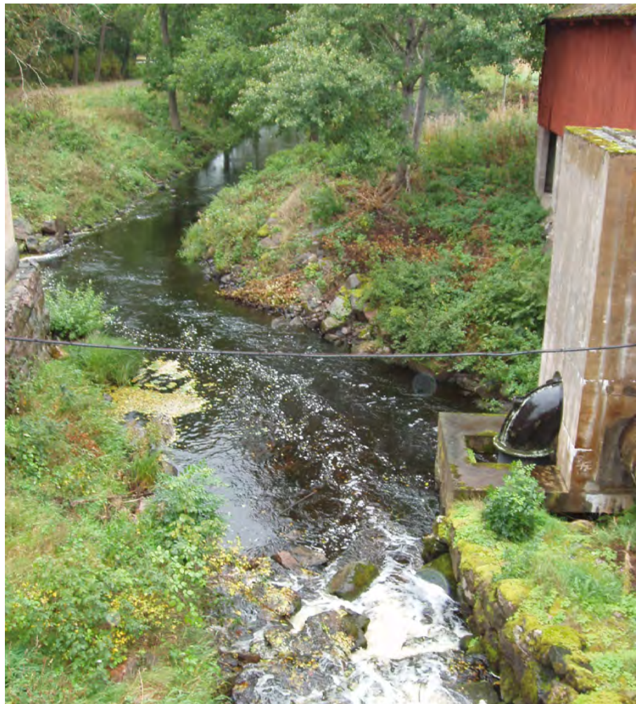
Länna bruk, Länna sn