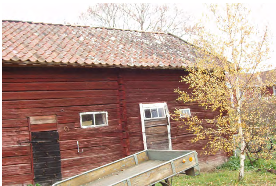
Äldre ekonomibyggnad i Nybble, Överselö sn