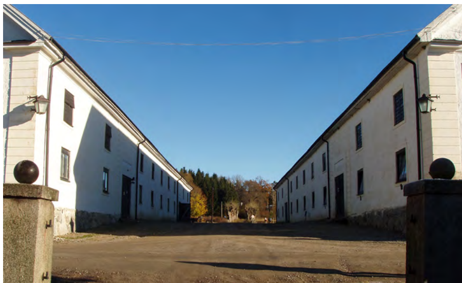
Ekonomibyggnader Herresta säteri, Toresunds sn