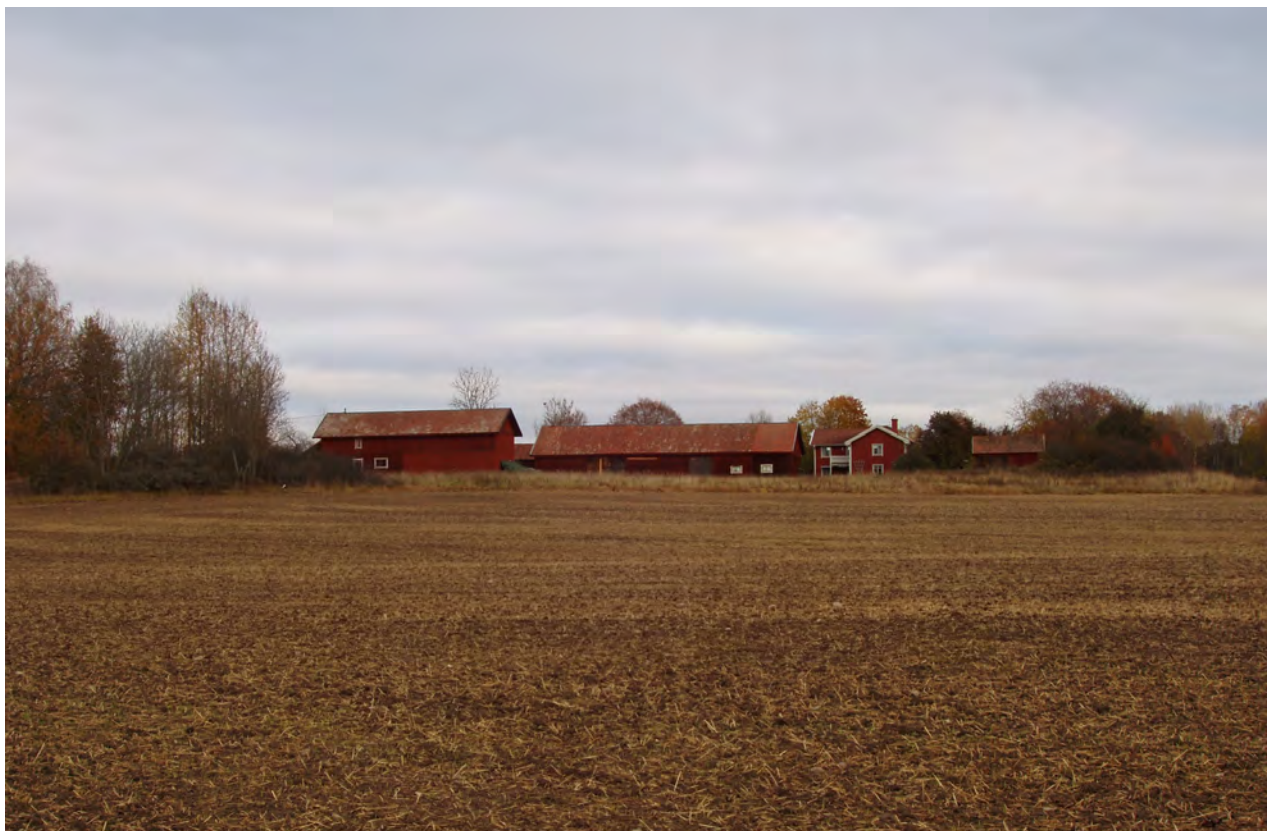
Nybble, Överselö sn