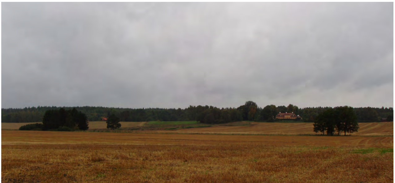
Dalgång med förhistorisk vattenled i dalbotten