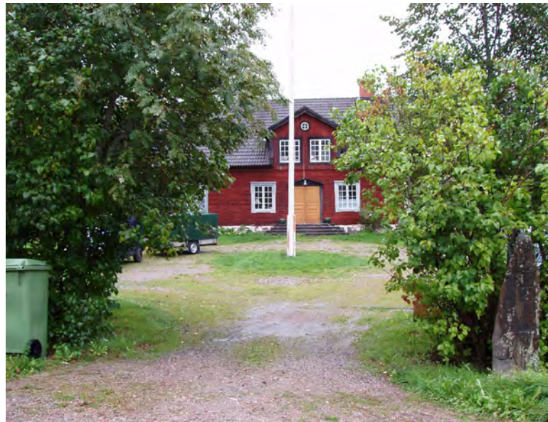
Byringe gästgivaregård längs Lohevågen, Länna sn

Bevara det öppna odlingslandskapet i dalgången. Bevara vattendraget, den förhistoriska vattenleden i dalbotten. Synliggöra fornborgar och rösen som kan kopplas till den förhistoriska vattenleden. Ny bebyggelse bör inte ske i den öppna dalgången.