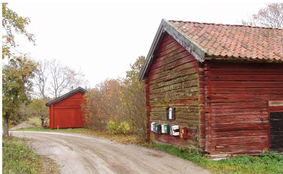
Bygata i Nybble, Överselö sn

Radbyarna har en karaktäristisk struktur med bygatan längs en av bytomtems sidor, mot vilken gårdstomterna ligger uppradade. I vissa byar med en yngre bebyggelsestruktur ligger mangård och fägård skilda åt på var sida om bygatan och i andra byar ligger byggnaderna längs tomtgränsen samlade kring en man- och fägård. Klungbyarna har en mer ”rörig” karaktär, där gårdarna samlas på en större höjd. Liksom i radbyn består varje gård av en man- respektive fäfunktion som till en början låg på samma gårdstun men som senare delades av.