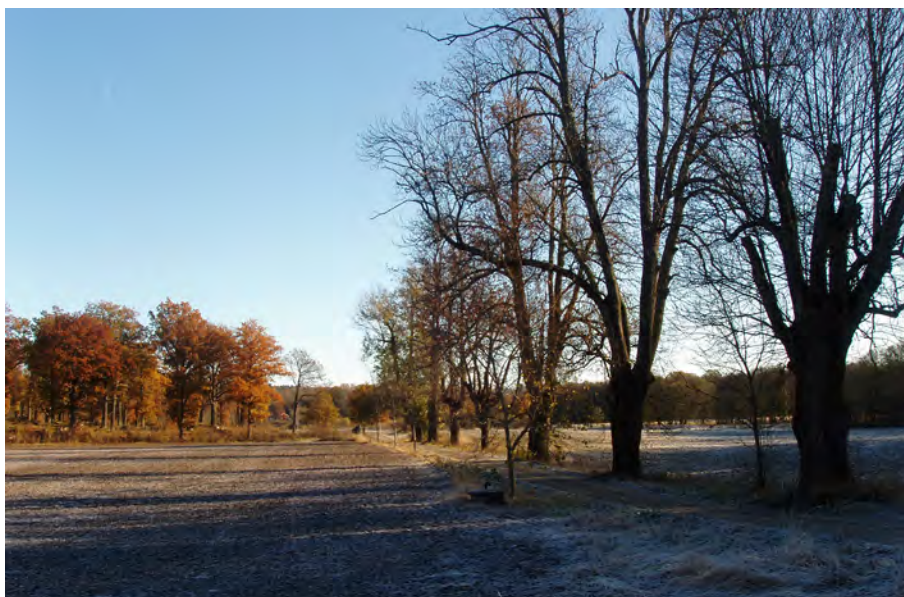
Allé, Herresta säteri, Toresunds sn