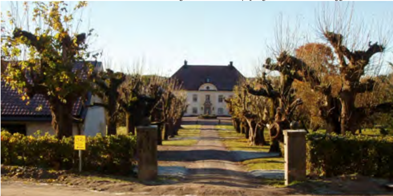
Herresta säteri, Toresunds sn

Här följer en förteckning på de kulturmiljöer som ingår i det regionala kulturmiljöprogrammet och som ligger inom