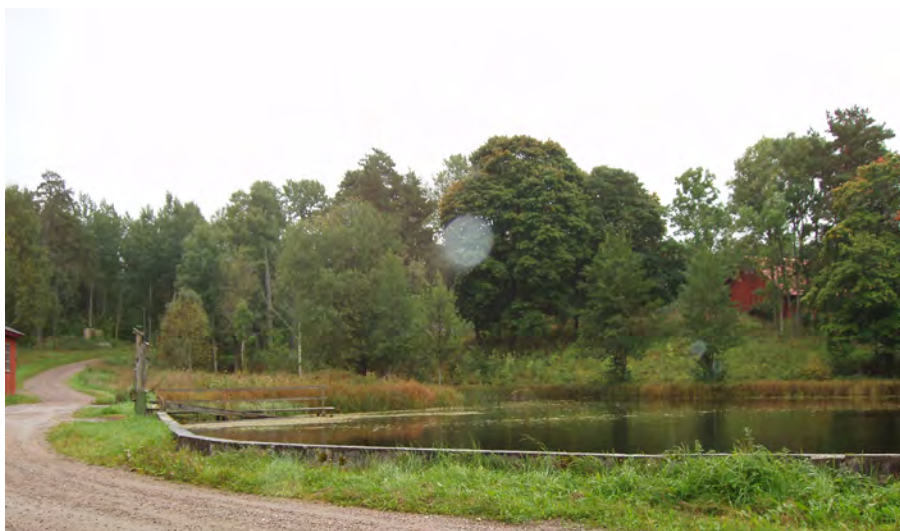
Dammanläggning, Länna bruk, Länna sn