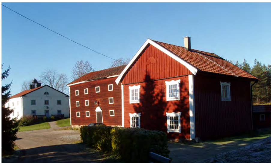
Äldre ekonomibyggnader på Herresta säteri, Toresunds sn