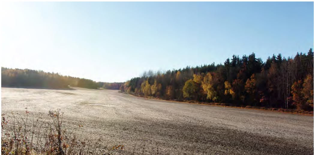
Storskalig åkermark, Herresta säteri, Toresunds sn