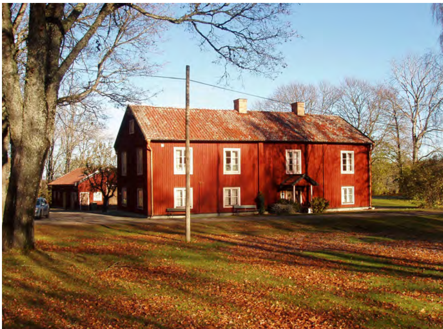
Skola i Toresunds kyrkby