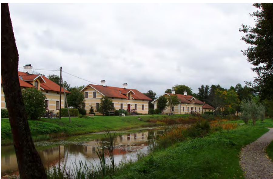
Arbetarbostäder, Åkers styckebruk