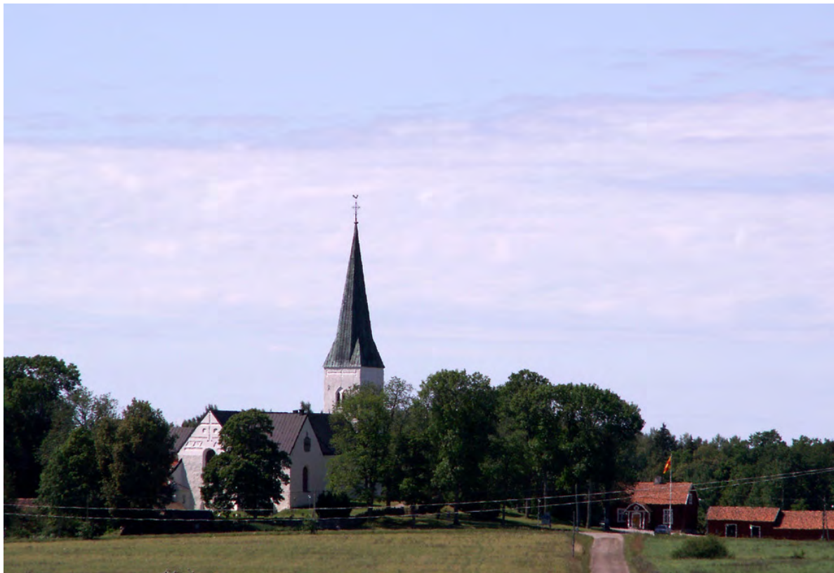
Fogdö kyrka