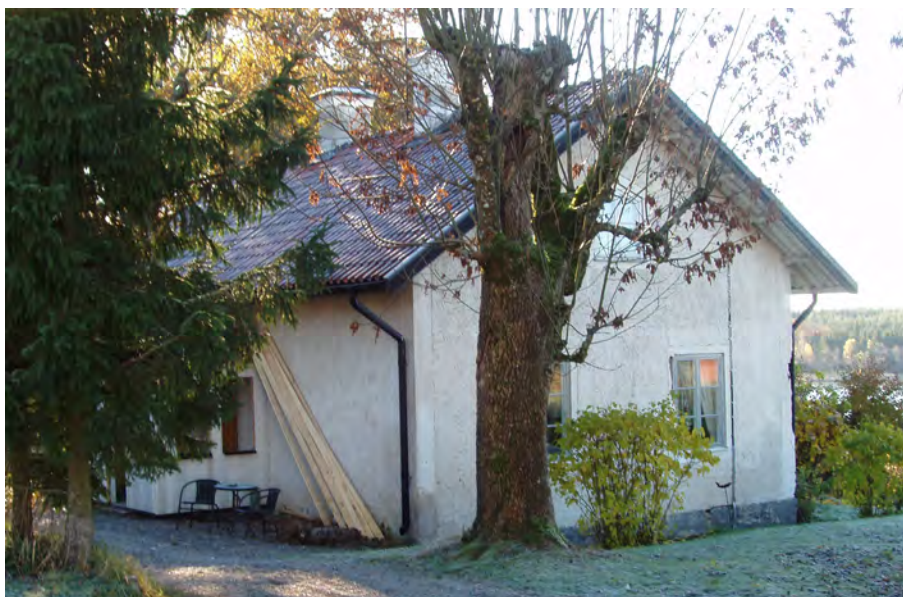
Arbetarbostad, Herresta säteri Toresunds sn