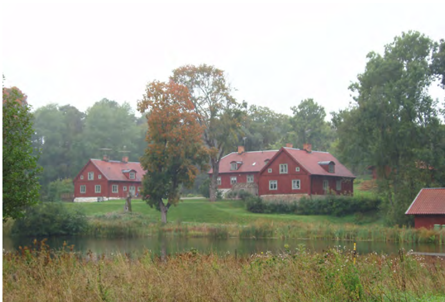
Länna bruk, Länna sn