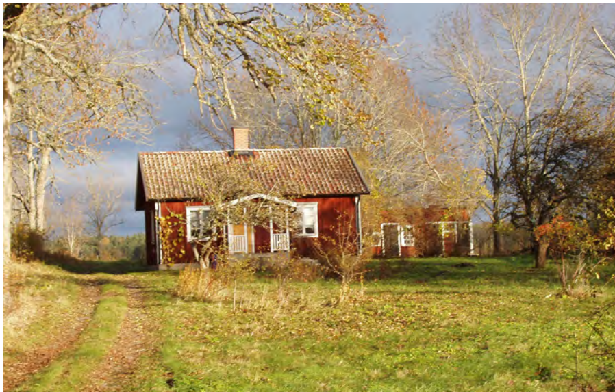
Torp Herresta säteri, Toresunds sn