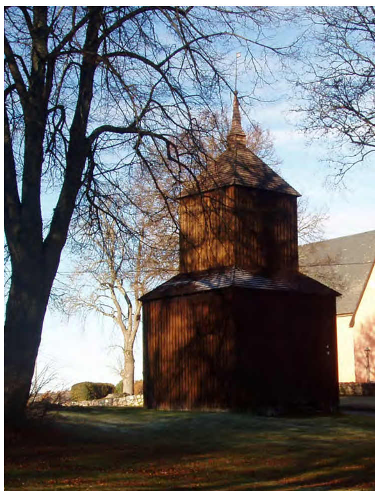
Klocktorn, Toresunds kyrka