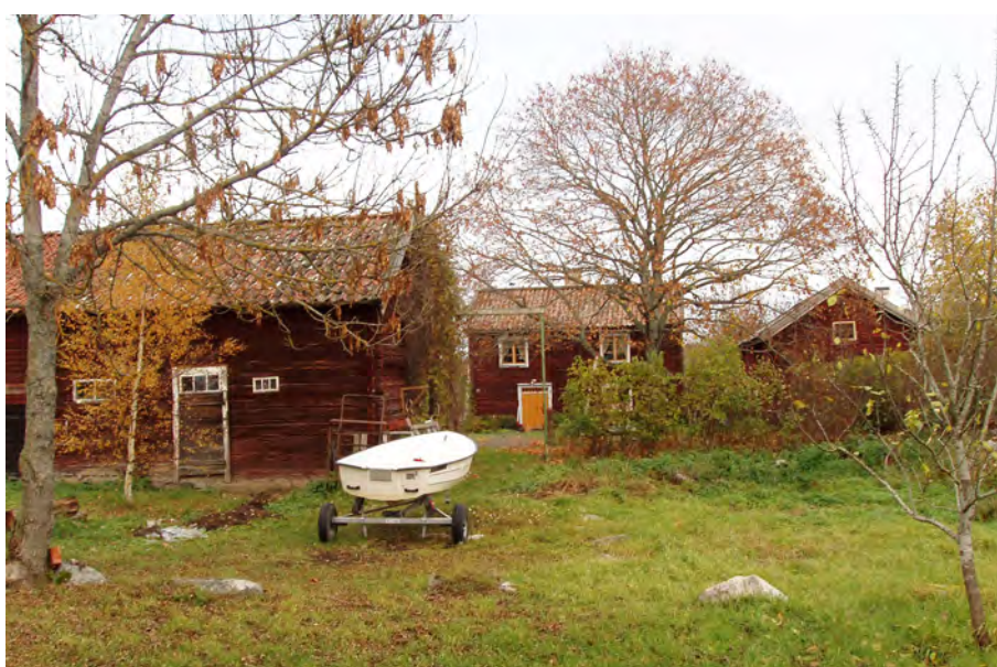
Gårdstomt i Nybble Överselö sn