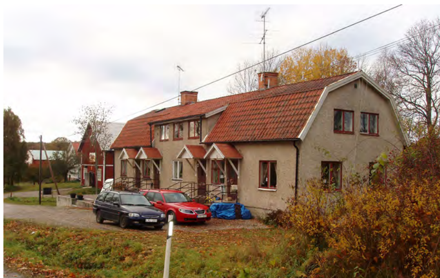
Arbetarbostäder, Mälsäkers slott Ytterselö sn