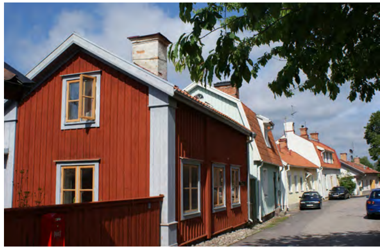
Rödfärg och bruten vit på knutar och fönsterfoder.

mörkbruna som mahogny och från slutet av 1800-talet kromoxidgrön. Sedan början av 1900-talet har vitt blivit allt vanligare på både fönster och foder, knutar etc. Från 1950-talet och framåt har färgindustrin utvecklats och färg köps sedan länge färdigblandad. Syntetiska pigment har gjort det möjligt att bryta alla tänkbara kulörer som i städer som Mariefred och Strängnäs kan avvika för mycket från traditionen och det omgivande stadsrummet. Historiskt sett bröt målaren själv sina färger från ett antal traditionella organiska pigment och några syntetiskt framställda vilket gav en begränsad färgskala.