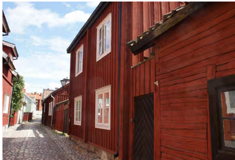
Fönstren sitter alltid i liv med fasaden i traditionell trähusbebyggelse.

Trä är det traditionella materialet och bör alltid väljas igen om inte fönstren har haft ett annat material ursprungligen. Fönster med blyspröjs förekommer under olika epoker och under slutet av 1800-talet tillverkades gjutjärnsfönster, framför allt till kyrkor, industribyggnader och ladugårdar. Aluminiumprofiler eller plåtklädda träfönster hör aldrig hemma i en gammal byggnad. Mot affärsgatorna har i regel skyltfönster antingen tagits upp i äldre byggnader eller varit en del av den ursprungliga arkitekturen. Ett intressant inslag av fönstermaterial finns till exempel i 1960-talsbebyggelsen utmed Storgatan i Strängnäs där flera skyltfönster är av blankt rostfritt stål. Materialet ger smäckra profiler och är exklusivt och tidstypiskt.