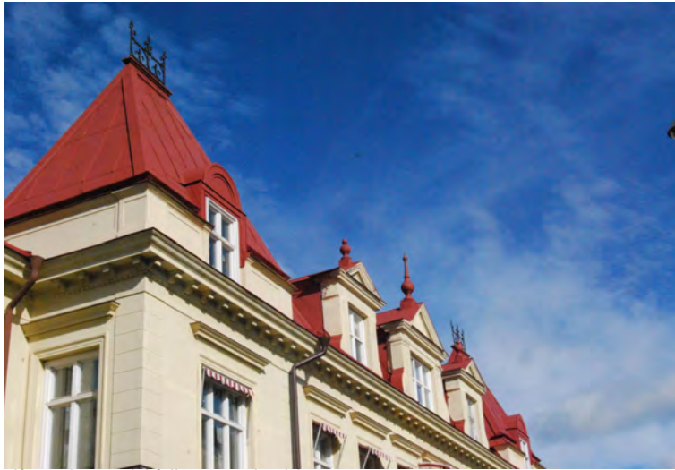
Plåt medger ett lekfullt varierat landskap.

stadskärna är plåttaken mer ovanliga men förekommer till exempel i de västra delarna kring Nygatan.