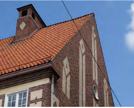
Nästan ingen takfot alls hör till nationalromantiken.

Vindskivor målas röda alternativt vita/ljusgrå beroende på husets karaktär. Rödfärgade vindskivor är mer ålderdomligt och återhållsamt och passar på äldre byggnader och uthus. I 1875 års byggnadsstadga förbjöds halm, torv, spån, torv, bräder eller andra eldfångda material i städerna. I stället förordades tegel, skiffer eller plåt. I Mariefred och Strängnäs är framför allt det enkupiga teglet vanligt och det passar alltid på de traditionella träbyggnaderna uppförda under 1700-1800-talen men är också mycket vanligt i bebyggelse uppförd under 1900-talet. När tegeltillverkningen blev industriell togs nya tegelformer fram, bland annat tvåkupigt tegel och olika platta tegelformer. Finns tegelformer från något av de många lokala, idag nedlagda tegelbruken i kommunen bör de alltid uppmärksammas och bevaras.