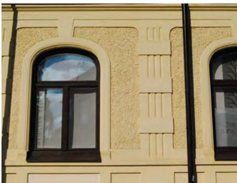
Jugendbyggnad där hela fasaden har samma kulör men där ytans struktur gör skillnaden.