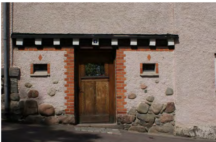
Individuellt utformad entré samkomponerad med byggnaden.