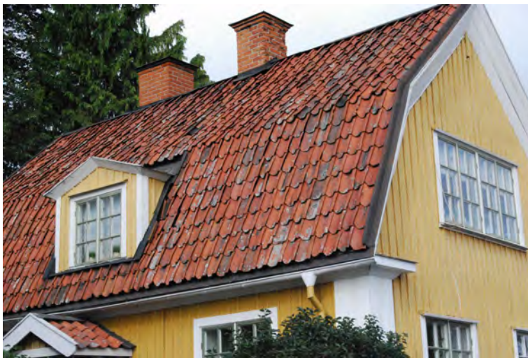
Enkupigt tegel är helt dominerande i Mariefred och Strängnäs.

Takfotens utformning, längd och tjocklek har stor betydelse. De uppfattade storlekarna av tak och fasad styr betraktarens bild av byggnadens proportioner och det är en faktor som arkitekter använt sig av för att betona fasad eller tak, ljus eller skugga. Takfoten har också en praktisk betydelse då den skyddar fasaden från regn och snö. En takfot med kraftigt språng minskar den uppfattade fasadhöjden samtidigt som takfallets längd ökar.