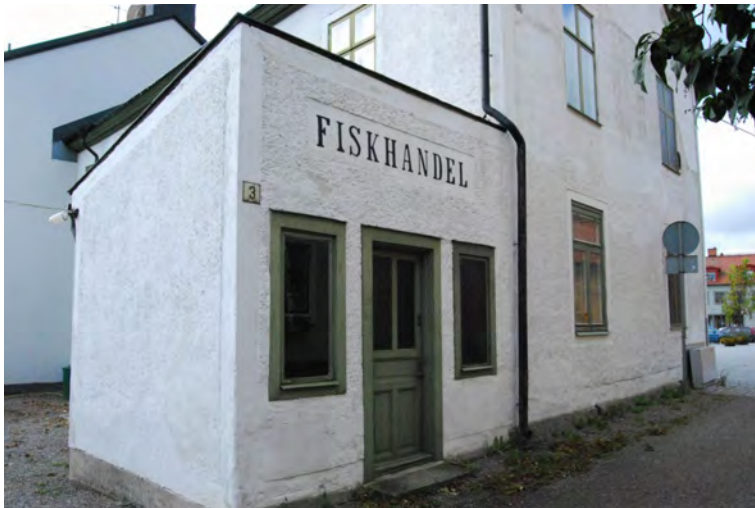
En liten unik tillbyggnad i Mariefred.

Inom båda städerna finns en förändringsvilja, fastighetsägare önskar bygga till och förnya. Utformningen av ett tillägg, till exempel en tillbyggnad, kan då bli föremål för diskussion. Skall ett tillägg utformas i samma stil som den befintliga byggnaden eller skall det få ett modernt formspråk för att historiskt redovisa att det är en ny del som inte skall förväxlas med den gamla? Eller något mitt emellan? Det finns inte något entydigt svar men i båda städerna är skalan inom området, materialen och färgsättningen viktig att följa. Det enskilda husets förutsättningar, tillbyggnadens art samt sammanhanget och stadsbilden spelar också stor roll.