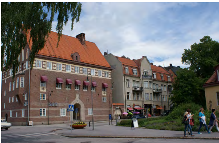
En nationalromantisk bankbyggnad med stor slät takmassa med två kraftiga skorstenar och en liten kupa. Intill ett brutet tak där de grunda kuporna är en del av den ursprungliga arkitektuen.

Vid inredning av vindar får takets utformning tas i beaktande och om det är lämpligt att bygga takkupor och/eller takfönster. På branta tak kan det ofta fungera bättre att bygga kupor än på flacka, men byggnadens arkitektoniska helhet ska beaktas. På de traditionella rödfärgade en- och tvåvåningsbyggnaderna bör kupor i regel undvikas. Skorstenar muras av tegel och vid tegeltak lämnas de ofta bara eller putsas. Ibland har de försetts med ett särskilt krön. Vid plåttak är skorstenen oftast plåtklädd och plåten kan ha formats med krön och lister. Skorstenars ursprungliga material och utformning är viktig att bevara och återställa vid renoveringsarbeten.