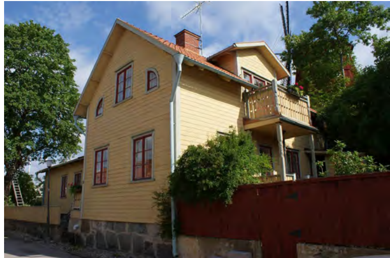
Mot slutet av 1800-talet blir det på nya trähus modernt med längre takfot och profilerade synliga taktassar som gav djupare skugga. Taken upplevdes fortfarande tunna.

Vindskivor målas röda alternativt vita/ljusgrå beroende på husets karaktär. Rödfärgade vindskivor är mer ålderdomligt och återhållsamt och passar på äldre byggnader och uthus. I 1875 års byggnadsstadga förbjöds halm, torv, spån, torv, bräder eller andra eldfångda material i städerna. I stället förordades tegel, skiffer eller plåt. I Mariefred och Strängnäs är framför allt det enkupiga teglet vanligt och det passar alltid på de traditionella träbyggnaderna uppförda under 1700-1800-talen men är också mycket vanligt i bebyggelse uppförd under 1900-talet. När tegeltillverkningen blev industriell togs nya tegelformer fram, bland annat tvåkupigt tegel och olika platta tegelformer. Finns tegelformer från något av de många lokala, idag nedlagda tegelbruken i kommunen bör de alltid uppmärksammas och bevaras.