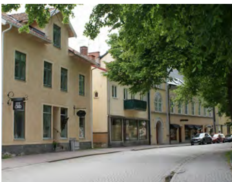
Stadsgata från slutet av 1800-talet.