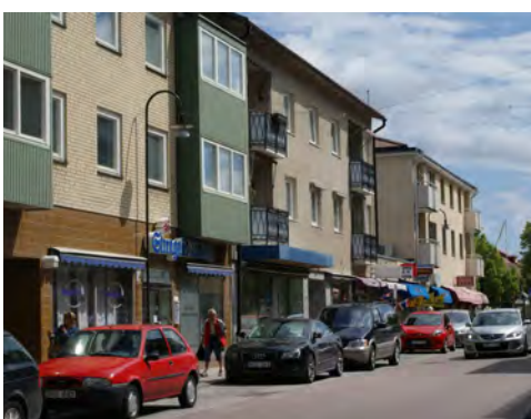
Stadsgata från 1950-60-talen.