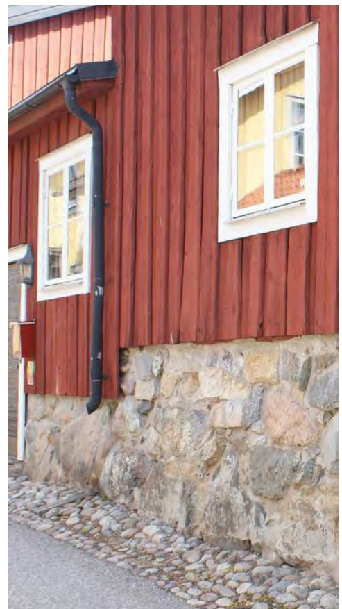
Städernas nivåskillnader märks i socklarnas varierande höjd.

Ett utmärkande drag i de kuperade delarna av både Mariefred och Strängnäs är angränsande byggnaders sockelhöjd ofta skiljer sig mycket åt. Man har undvikit att spränga och byggnaderna har anpassats efter terrängen och berg i dagern. Socklarna består i regel av obearbetad sten. Vid förändringar i dessa delar bör sprängningar och mer omfattande utjämningar alltid undvikas och den stora variationen behållas. Vid senare uppförd bebyggelse har marknivåerna ofta förändrats och sockelns sten har fått en mer bearbetad yta eller en puts. Sockelns utförande har stor betydelse för byggnadens uttryck och ska därför värnas.