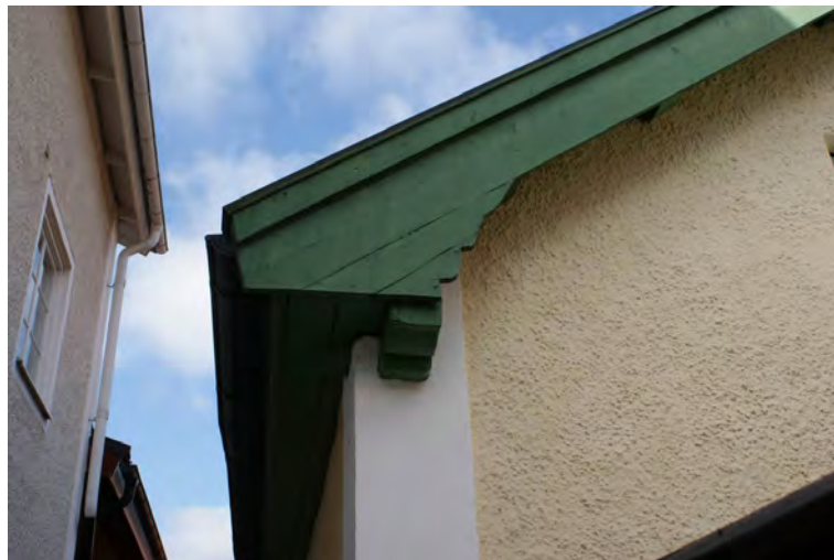
De reveterade trähusen har ofta spritputsade fasader och slätputsade knutar.

Friliggande timrade fasader förekommer ganska ofta och de kan efter hand bli utsatta för väder och vind. Då kan det bli aktuellt att klä med panel av okantade bräder eller locklistpanel. Ibland behöver bara knutändarna kläs in, något som också förekommer på många byggnader. Under början av 1900-talet blev enfärgade ljusa putsade fasader vanligt på nya bostadshus och utsmyckningar