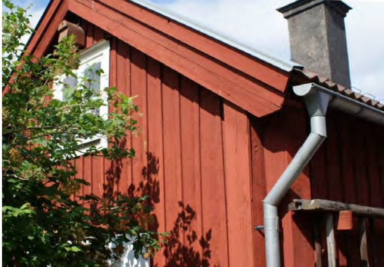
Traditionellt hus med tegel, kort takfot samt rödfärgade vindskivor och knutar.

Den traditionella takformen i båda städerna är sadeltak, ibland med variationer, brutet och/eller valmat. Pulpettak och tälttak förekommer på uthusbyggnader men först under 1930-tal och 1960-70-talen blir det vanligt på huvudbyggnader. Då introduceras också platta tak. Till dessa takformer fungerar plåt eller papp bäst.