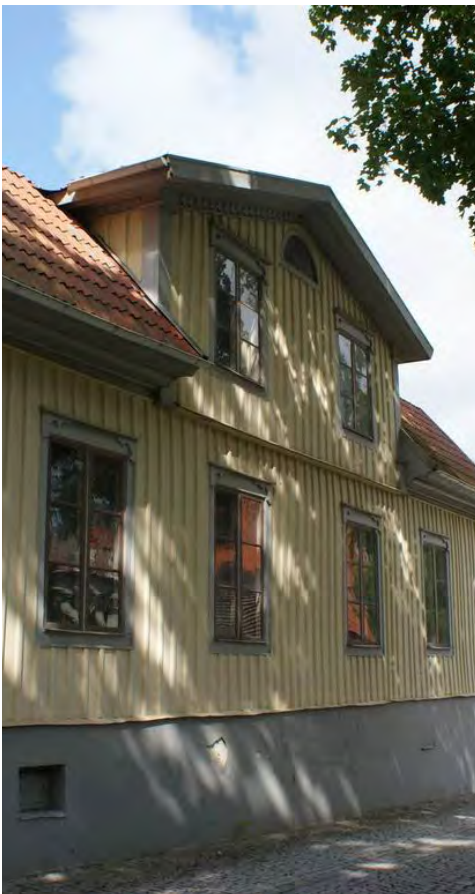
Panelarkitektur med traditionell färgsättning.

Inför ommålning av oljefärgade träfasader kan man undersöka äldre färglager genom att skrapa lite på skyddade platser och se om äldre skikt är bevarade. För att tolka framskrapade prover och översätta dem till en välstämd färgsättning som passar på byggnaden och i sammanhanget behöver man ofta anlita en inom området sakkunnig person. En övergripande riktlinje för att undvika alltför ljusa och intensiva kulörer i Mariefred och Strängnäs är emellertid att utgå från de traditionella pigmenten. Det begränsar urvalet men ger en harmonisk färgskala. Idag framställs de i regel på syntetisk väg men håller man sig inom deras spektra fungerar det ofta bra. De bryts ofta med vitt för att få en ljusare kulör och/eller lite svart eller grön umbra för att ta ner kulörtheten. Till pigment som använts på fasader är främst olika ockror, umbror och terror. Till fönster ockror, engelskt rött, järnoxidröd- och brun, kromoxidgrön, zinkgrön. Att använda linoljafärg hör också till det traditionella byggnadsmåleriet.