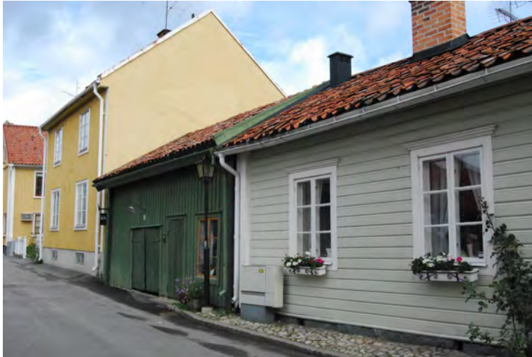
Pedagogen 8 och 10, två före detta uthusbyggnader som omvandlats till bostäder.