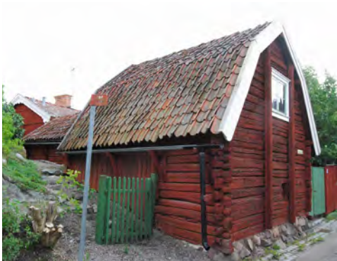
Båtsmansberget 14, ekonomibygnad som enligt uppgift innehållit en smedja.