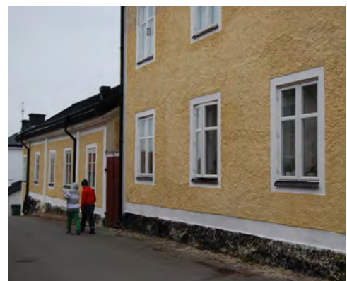
Reveterad byggnad vid Kungshustorget, kv Krukmakaren 6. Den lägsta delen från 1700-talet, den högre från 1890-talet.

Fram till 1800-talet slut var övervägande delen av alla typer av bebyggelse panelad och rödfärgade. Vid denna tid blev det vanligare att måla bostadshusen i ljusa linoljefärger eller revetera dem, d v s putsa och måla dem med kalkfärg, också då i ljusa kulörer.