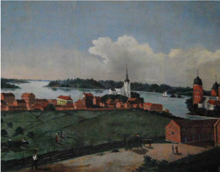
Staden sedd från Kärnbo kyrkoruin med kungsladugården och slottet till höger. Kopia efter tavla av Pehr Hilleström 1802.