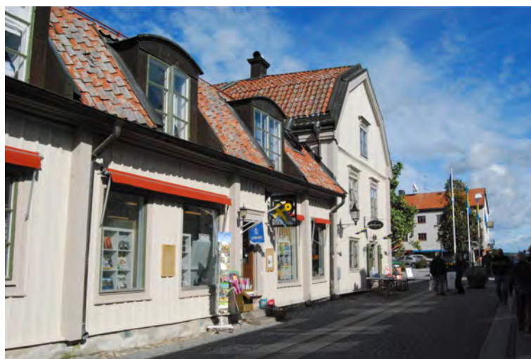
Kvarteret Snickaren vid Storgatan är en handelsgård som bland annat inrymt apotek. På gården ligger några före detta ekonomibyggnader som har byggts om till bostäder.

Till en början bedrevs mycket handel i tillfälliga stånd, bodar, från vagnar och kärror vid speciella marknadsdagar. Under 1830-talet permanentades handeln allt mer till handelsgårdar med bodar mot gatan som efter hand kunde hålla öppet varje dag. En handelsverksamhet kunde vara mer lukrativ än en hantverksrörelse men krävde ett större utestående kapital för t ex lagerhållning. En annan faktor som utmärkte handelsgården var att själva gården var parkeringsplats för de tillresta ekipagen från landsbygden som också skulle kunna stallas upp och utfodras, ibland fanns också övernattningsrum för långväga kunder. Det krävdes alltså större plats, fler byggnader, magasin för spannmål etc. Kapitalet bands i fast egendom och handelsvaror. På gården bodde också de anställda. Utrymmet för odling inom tomten var därför begränsat. Inom handelsgårdarna försvann jordbruksdriften tidigare än hos hantverkarna.