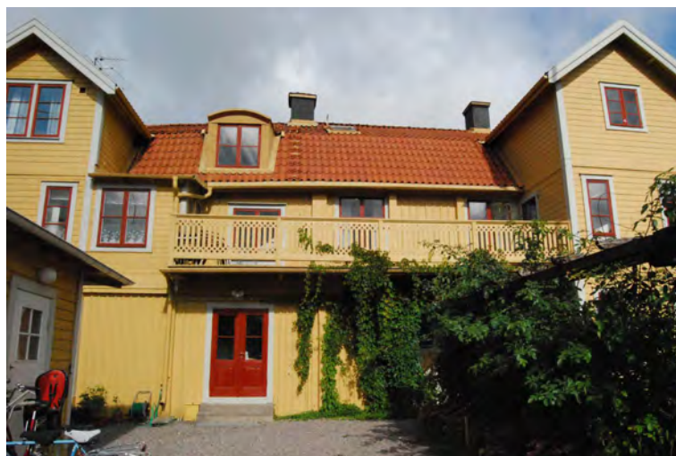
Köpmannen 1 från sedd från gården.

För hantverkarna innebar skråväsendets avskaffande 1846, och den näringsfrihet som då inträdde, förändringar. Bland annat blev det tillåtet att bedriva hantverk även på landsbygden.