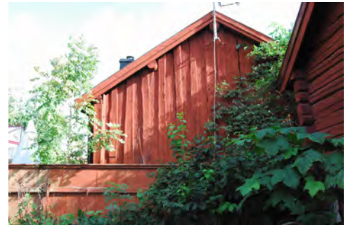
Kv Kungshusen 11, gården med rökeribyggning i tegel från tidigare charkuterirörelse.

Under början av 1900-talet genomgick Bellmansgården en för tiden typisk utveckling genom att flera av de äldre byggnaderna ersätts med ett modernt tvåvåningshus av sten för en bagerirörelse.