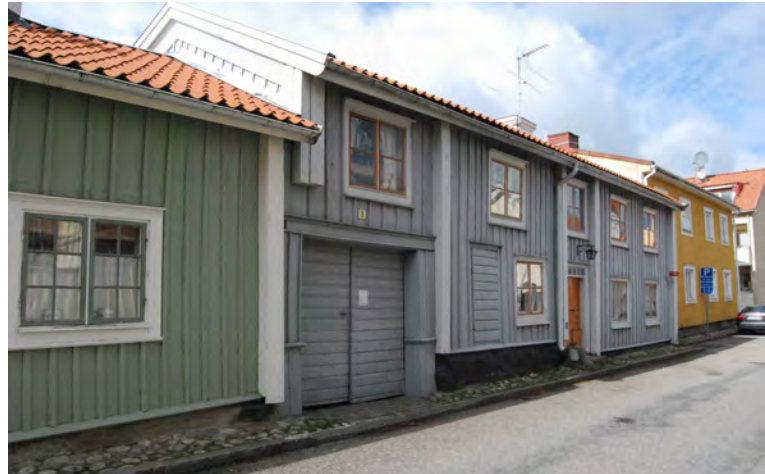
Kvarteret Garvaren målat i ljusa oljefärger.

Traditionellt placeras bostadshuset mot gatan och stall och verksamheter inne på gården. Borgargårdarnas bebyggelse och mellanliggande plank sluter gaturummet så att inga trädgårdar eller planteringar syns mot gatan. Byggnaderna orienteras oftast med långsidan mot gatan förutom vid gathörnen. Bebyggelsen inom en tomt ligger också i regel utmed tomtgränserna, sällan fritt inne på tomten, så att en gårdsplan bildas. Byggnaderna inne på tomterna ligger ofta rygg i rygg med en byggnad på granntomten. På de mest tätbebyggda tomterna bildas en gård omsluten av byggnader.