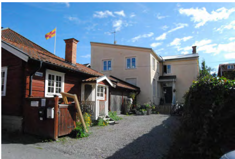
Den ljusa putsade byggnaden på gården uppfördes till en bagerirörelse 1900, kvarteret Borgmästaren 5.