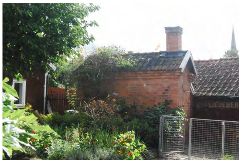
Kv Kungshusen 11, gården med rökeribyggnad i tegel från tidigare charkuterirörelse.