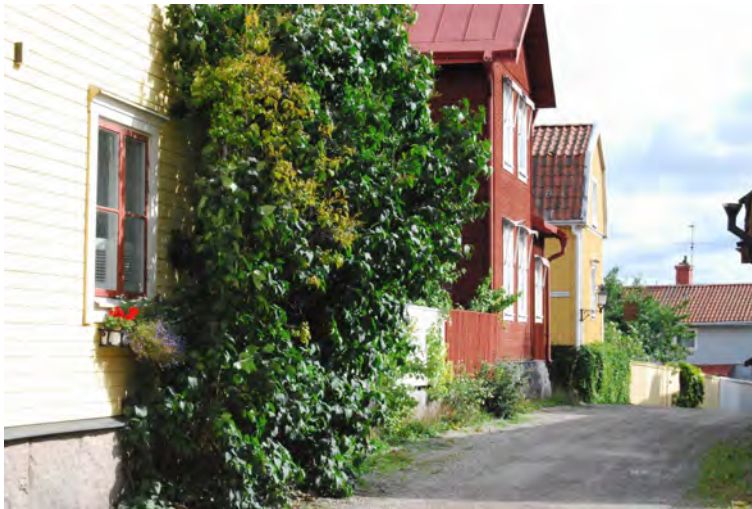
En av Mariefreds välbevarade gatumiljöer

Mariefreds hembygdsförening har dokumenterat flera gårdars utveckling och också publicerat materialet i häften och i bokform. Materialet är mycket grundligt och bör användas vägledande i frågor där till exempel byggnaders ursprungliga funktion diskuteras.