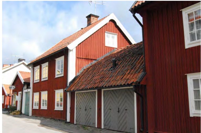
Kv Kungshusen 11 och 9 ( f d 4 och 3) utgör de mest välbevarade borgargårdarna

Flera olika system för numrering av stadens tomter har förekommit. Efter branden 1682 numrerades tomterna från 1 till 85. På 1760-talet ändrades numreringen något då vissa styckningar gjorts men numreringen var ännu löpande. 1917 övergick man till kvartersnamn med numrering, den ordning som ännu används.