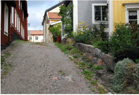
En av Mariefreds välbevarade gatumiljöer