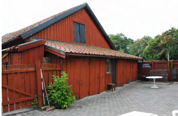
Ekonomibygnad på gården, Köpmannen 7