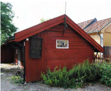
I Callanderska gården, kv Sjömannen 1, låg ett färgeri. Norra delen av uthuslängan är uppförd av korsvirke.

Under Gustaf III:s tid rådde en befolkningstillväxt och byggboom i staden. Man byggde på envåningshusen med en våning och förmodligen tillkom nya byggnader. Antalet hus på varje tomt verkar ha ökat under 1800-talet för att minska mot århundradets slut.